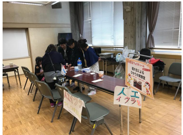
図5 人権フェスでの様子