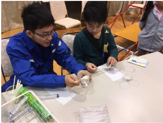
図3 きてみてフェアでの様子2