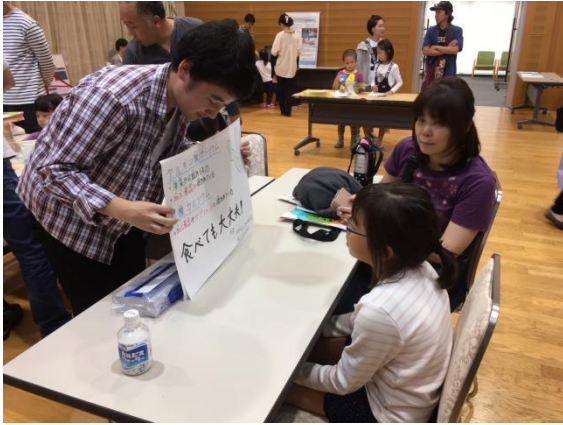
図2 きてみてフェアでの様子1